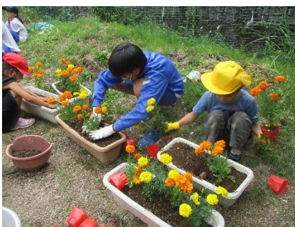
6月12日に全校で花をプランターに移植する作業をしました。200株近い花が、学校を美しく飾っています。