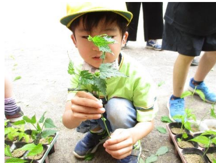
1～4年生、山吹の挿し木(生活・総合)