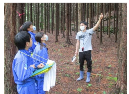
6年生の理科。近くの学校林での授業です。