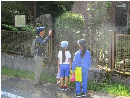
3年生の「校区探検」(社会)