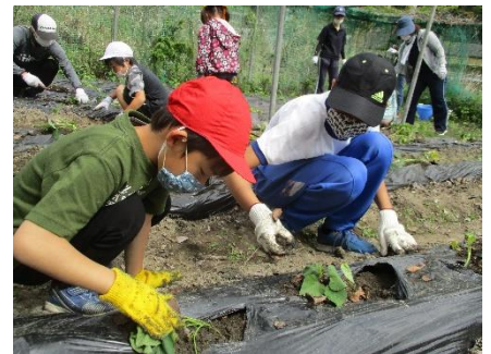
全校でサツマイモの苗を植えました。