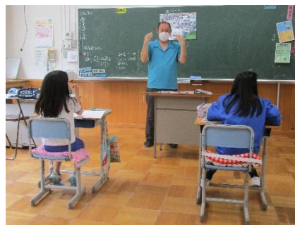
5年生の社会。5年生は姿勢の良さが素晴らしいです。