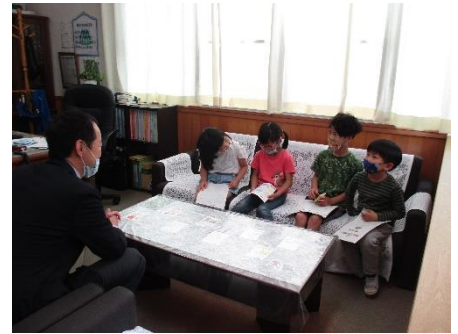
1・2年生の「学校探検」。校長室を訪ねてくれました。