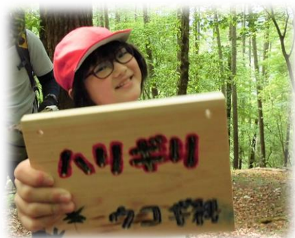
4年生は樹名板を設置します。