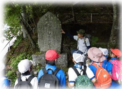
登山口。天皇が登山された記念碑の説明。