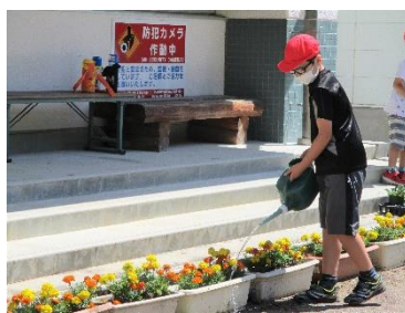
分担して毎日水やりをしています。