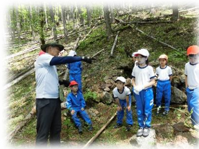
炭焼き窯の説明風景です。