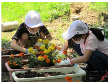
全校でプランターに植えました。