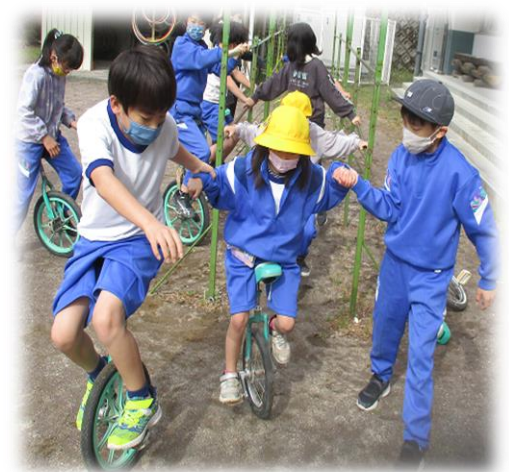
1年生に一輪車を教える上級生

夏休みは今までの学習や生活を見つめ直し、新学期に備え新しい目標に向かって準備する絶好の機会です。新学期が始まる8月23日には、子どもたちの元気いっぱいの笑顔に会えることを心から楽しみにしています。